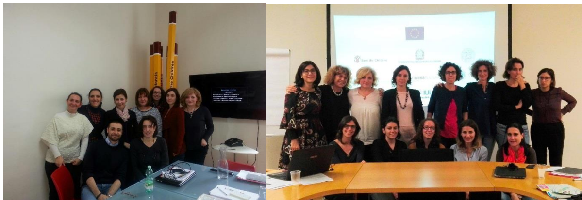
CRAC partners meetings in Rome and Lisbon, 2016

В рамките на партньорството между трите държави, две международни срещи бяха организирани през 2016. През март 2016 представители на ФПБ, Спасете децата, Италия, Университета на Болоня, Министерство на правосъдието на Италия и PAR, Португалия, се срещнаха в Рим на своята първа среща за планиране и развитие на изследователска и приложна методология. През ноември 2016 партньорите се срещнаха в Лисабон, Португалия, за обмен на опит и практики, дискусия на постиженията и предизвикателствата и развитие на по-нататъшен план за работа в корекционните институции за деца и младежи.