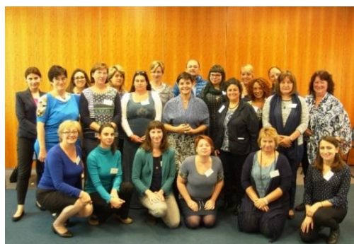
Среща на партньорите в Будапеща, май 2016 .г