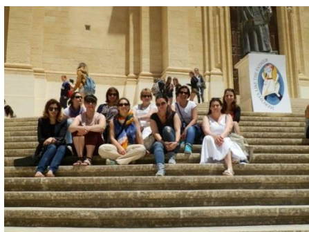
Среща на партньорите в Малта, май 2016 .г