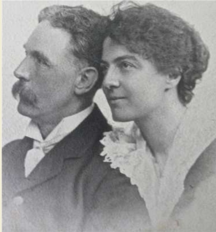
Рис Дейвидс разглежда будизма като „наука за ума“ и като „етическа психология“.

„Будист или не будист, аз изследвах всяка една от великите религиозни системи на света и в нито една от тях не открих нещо, което да надмине по красота и всеобхватност, Благородния Осмичен Път на Буда“.